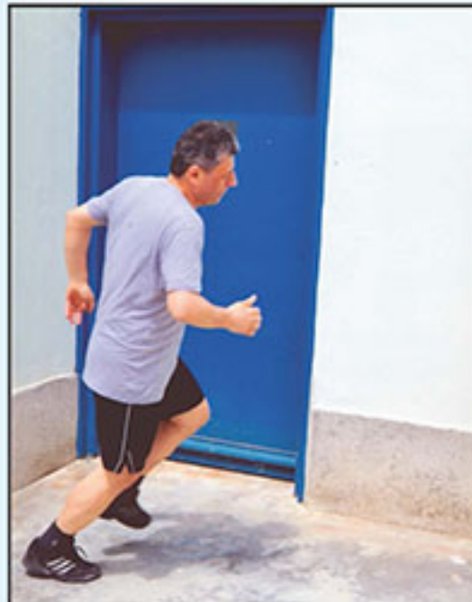
14 adımlık havalandırmaya