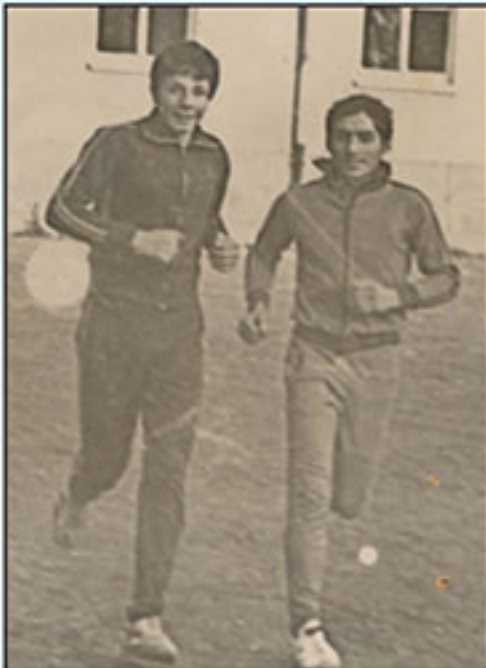
Nazilli'nin özgür alanlarından

Bu parti içi demokrasi şölenine katılarak yepyeni hedefler edinmek, yukarıda paylaştığım başarılarımı İzmir'e ve Türkiye'ye taşımak istiyorum.